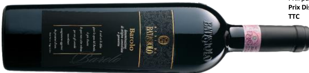
BAROLO 2015 BENI BATASIOLO Italie

Prix public : 19,00 € TTC Prix Discount : 12,00 € TTC