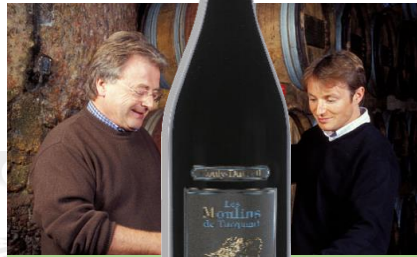
SAUMUR CHAMPIGNY 2018 « LES MOULINS DE TURQUANTS » Domaine Couly Dutheil

Prix public : 11,50 € TTC Prix Discount : 7,50 € TTC