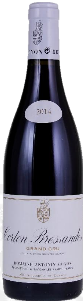
CORTON BRESSANDES GRAND CRU Domaine Antonin Guyon 2018

Prix public : 90,00 € TTC Prix Discount : 77,00 € TTC