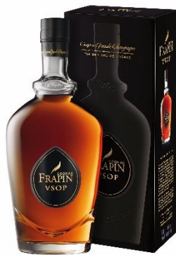
COGNAC FRAPIN GRANDE CHAMPAGNE VSOP Meilleur VSOP du monde en 2016

Prix public : 44,00 € TTC Prix Discount : 37,00 € TTC