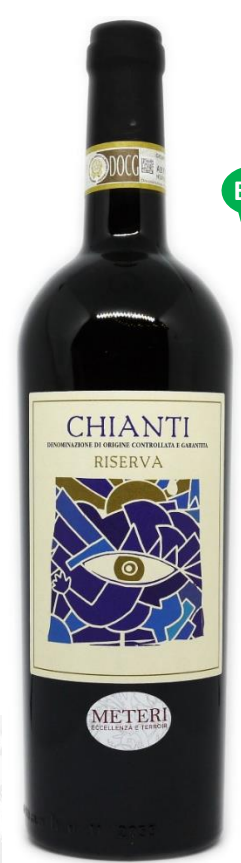
LA GINESTRA 2017 CHIANTI RISERVA BIO Italie

Prix public : 15,00 € TTC Prix Discount : 11,00 € TTC