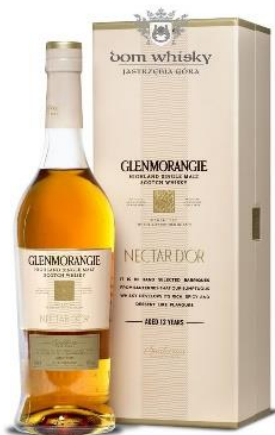
SCOTCH WHISKY SINGLE MALT GLENMORANGIE NECTAR D'OR

Prix public : 59,00 € TTC Prix Discount : 48,00 € TTC