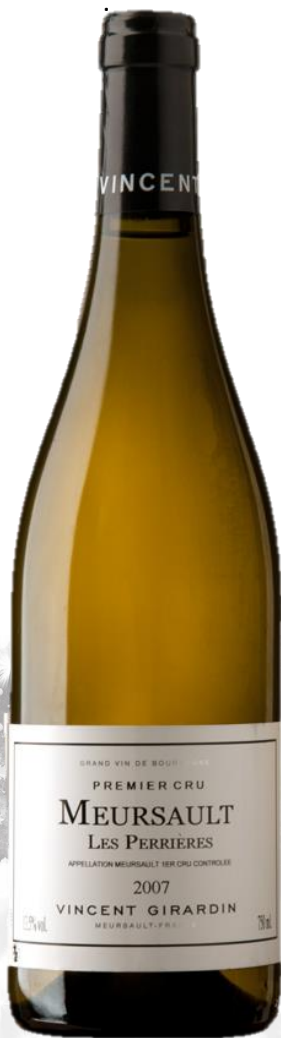
MEURSAULT PREMIER CRU Les Perrières Domaine Girardin 2014

UN LIEU D'HISTOIRE - TRADITION - PERFECTION