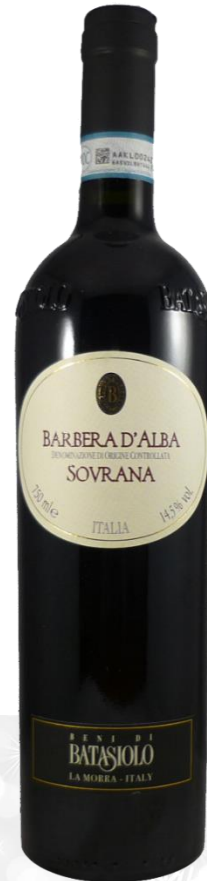
SOVRANA 2016 BENI BATASIOLO

Prix public : 11,00 € TTC Prix Discount : 7,50 € TTC