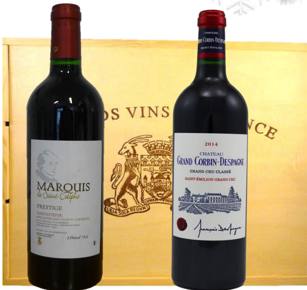
MAGNUM Marquis Saint Estèphe Prestige 2015 Saint-Estèphe

Prix public : 37,00 € TTC Prix Discount : 28,00 € TTC