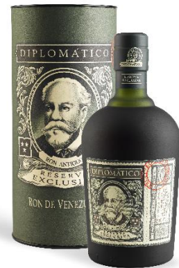
VIEUX RHUM DIPLOMATICO EXCLUSIVA RESERVA 12 ANS, VENEZUELA

Prix public : 39,00 € TTC Prix Discount : 33,50 € TTC