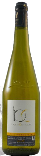
MUSCADET "CHAMBAUDIÈRE" Domaine Cormerais 2018

Prix public : 10,00 € TTC Prix Discount : 6,00 € TTC