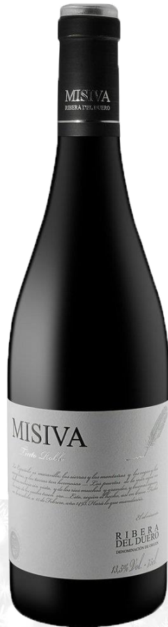
MISIVA RIBERA DEL DUERO 2019 Fincas de Azabache, Espagne

Prix public : 9,00 € TTC Prix Discount : 6,50 € TTC