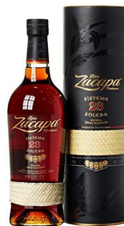
VIEUX RHUM RON ZACAPA SOLERA 23 ANS D'ÂGE, GUATEMALA

Prix public : 61,00 € TTC Prix Discount : 49,50 € TTC