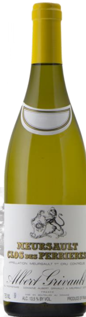
MEURSAULT 1ER CRU 2017 "Clos des Perrières" Domaine Albert Grivault

Prix public : 100,00 € TTC Prix Discount : 80,00 € TTC