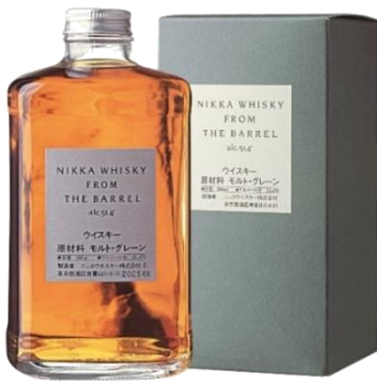
NIKKA FROM THE BARREL WHISKY JAPONAIS