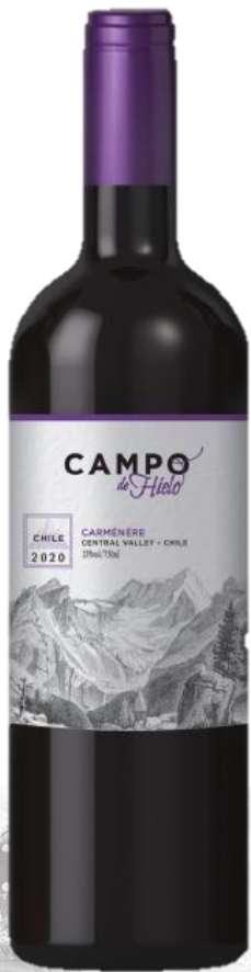
CENTRAL VALLEY 2018 CAMPO DE HIELO Chili

PROMENADE ŒNOLOGIQUE - AROMATIQUE - GOURMAND