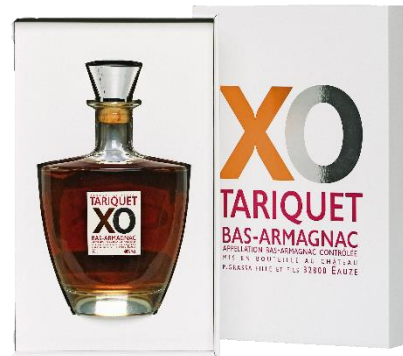
BAS-ARMAGNAC CHÂTEAU DU TARIQUET XO ÉQUILIBRE 93/100 Wine Enthusiast

Prix public : 59,00 € TTC Prix Discount : 48,00 € TTC