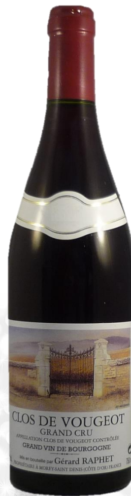
CLOS VOUGEOT Grand Cru Domaine Raphet 2015

Prix public : 140,00 € TTC Prix Discount : 110,00 € TTC