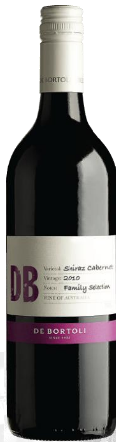
DE BORTOLI 2016 SHIRAZ CABERNET Australie

Prix public : 9,00 € TTC Prix Discount : 6,50 € TTC