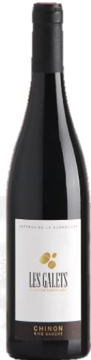
CHINON « LES GALETS » 2019 Château La Bonnelière

Prix public : 10,00 € TTC Prix Discount : 6,00 € TTC